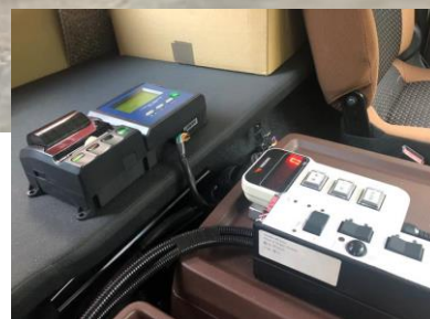
運転席に搭載のデジタル計測器 (記録シートプリントアウト可能)