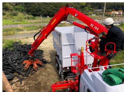
コントロールレバーで重機操縦